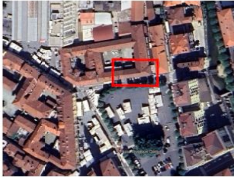
FOTO AEREA CON INDIVIDUAZIONE FABBRICATO